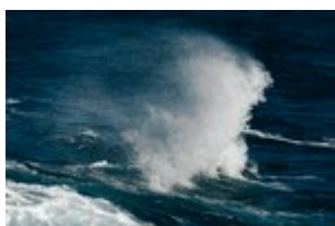
The wave - Dolph Kessler (14).jpg 1012.41 KB