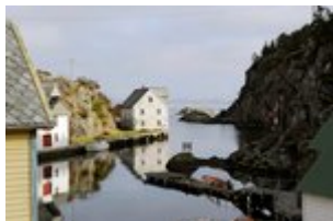
Noordzee rond - Dolph Kessler (3).jpg 666.32 KB

Kijk voor meer informatie op www.hetscheepvaartmuseum.nl .